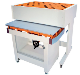
Mesa para la preparación de formas