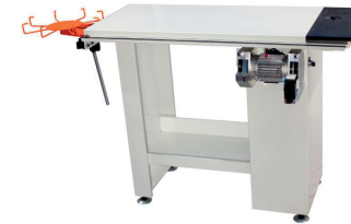
Mesa para moldear las cuchillas