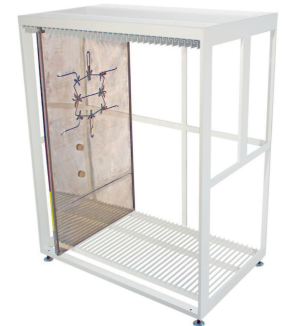
Estante de almacenamiento de formas